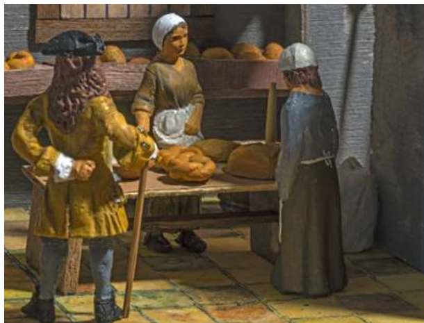
Botiga fleca 1700 (Maqueta Jaume Serra - DSC-6748)

Obrim l'edició amb aquest 1700 , viure en temps de guerra. 1, blat i pa, centrat en el llarg procés que porta de la sembra del cereal fins al pa a taula, sense oblidar alternatives com l'arrós i la patata i amb referències a fets culturals i històrics que condicionen la vida quotidiana.