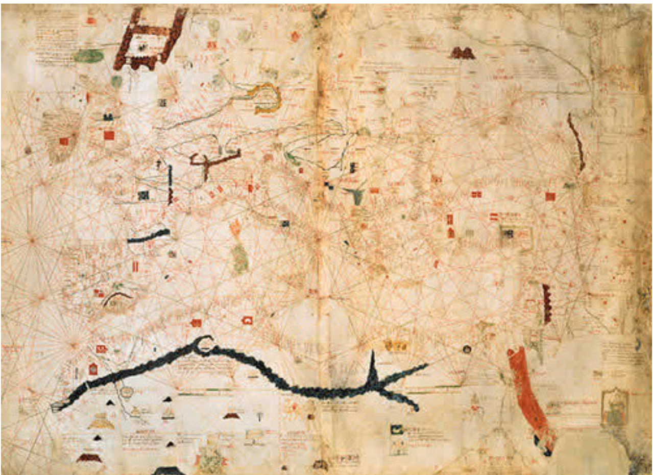
Angelino Dulcieri o Dulcert- Feta a Mallorca el 1339.

Però potser el document més antic on apareix en català- el cap de Pals - de Múrcia és a la carta nàutica d'Angelino Dulcieri o Dulcert feta a Mallorca el mes d'agost de l'any 1339 tal i com hi consta a la llegenda que hi ha en el seu peu. Aquesta carta nàutica és anterior a la d'en Cresques de l'any 1375. Recordem que els catalans sota les hostes de Jaume I el conqueridos són qui repoblen Múrcia entre d'altres llocs, així doncs és evident que la toponímia d'aquells indrets fos la dels conqueridors.