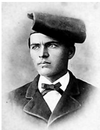
Mossén Jacint Verdaguer,

Aquesta llegenda pirenaica del temps de la Reconquesta catalana va ser l'obra més celebrada per tothom i la va dedicar als catalans de França. Verdaguer ens trasllada a l'època dels primers comtes catalans, Guifré i Tallaferro, que foragiten els sarraïns de les valls pirinenques.