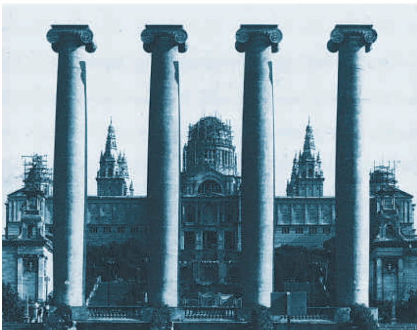
Las Quatre Columnes de Puig i Cadafalch a finales de los años veinte

La ubicación original, delante de la fuente monumental, se desplaza unos metros para tener la misma visión que en 1919