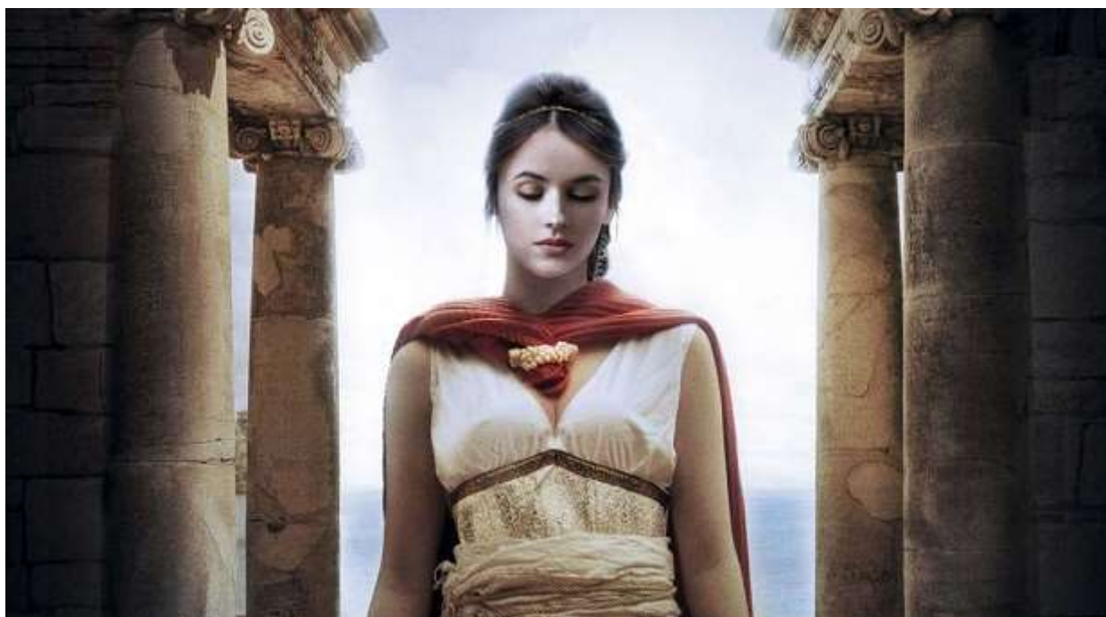
Imatge de "A Barcino" una de les obres més exitoses de M. Carme Roca.

«No podré viure prou anys per explicar totes les històries que em ballen dins del cap»