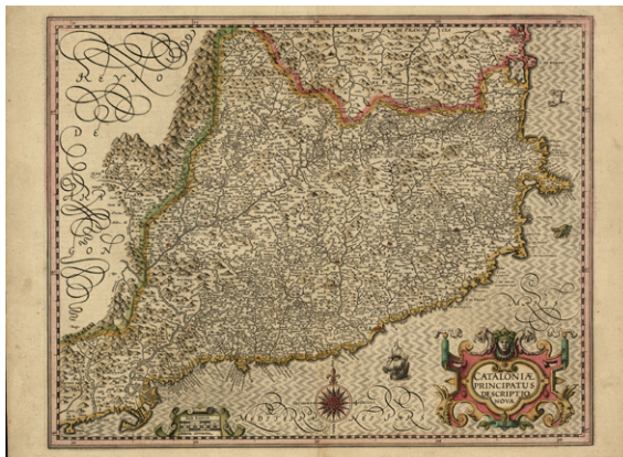
Mapa de Catalunya, de G. Mercator i H. Hondius, 1619. L'acolorit, a mà, caracteritzava cadascuna de les edicions (Cartoteca de Catalunya, RM.4560)