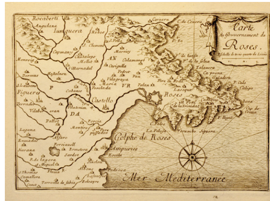
Als Petits Beaulieu, hi trobem mapes d'àmbit regional o comarcal, les anomenades Cartes de Gouvernement, com aquesta de Rosas (Cartoteca de Catalunya, RL.9721)