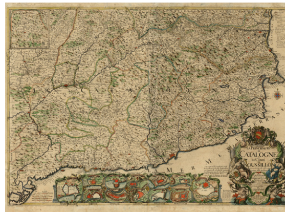
Mapa de Catalunya de l'Abbé Baudrand publicat a París per I.B. Nolin. Se'n coneixen cinc edicions entre 1695 i 1762. Aquesta edició és de 1703 (Cartoteca de Catalunya, RM.4134)