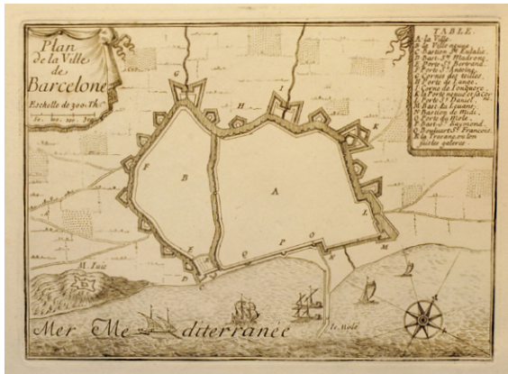
Plànol de les muralles de Barcelona que apareix en el llibre conegut com el Petit Beaulieu (Cartoteca de Catalunya, RL.9721)